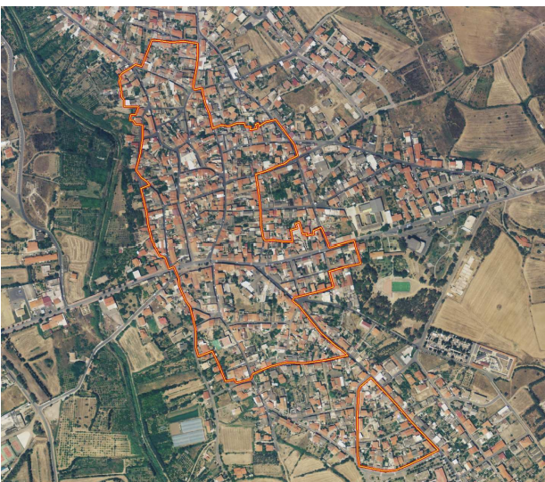
b) Perimetro del Centro di Antica e Prima Formazione