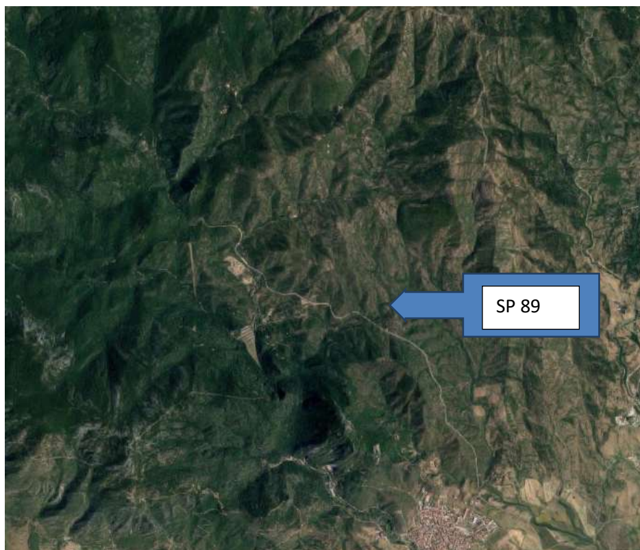
Figura 2 Strada Provinciale SP89 unica viabilità soggetta ad eventuale rischio Neve.

L'altra strada che percorre il comune con stesso asse è la strada comunale 197 che porta dal centro di Domusnovas fino all'imbocco alle Grotte di San. Giovanni seguendo il rio San Giovanni, che attualmente è stata chiusa al transito veicolare proprio nel tratto che in passato si percorreva dentro le Grotte stesse. Per tale motivo questo tratto di viabilità non si può considerare attivo.